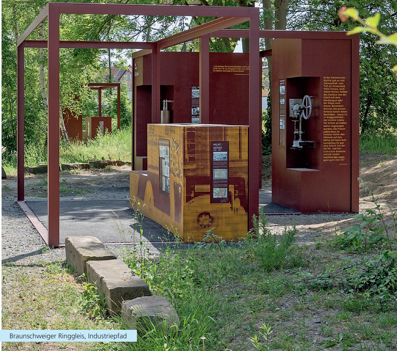
Braunschweiger Ringgleis, Industriepfad